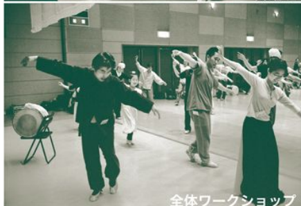
全体ワークショップ